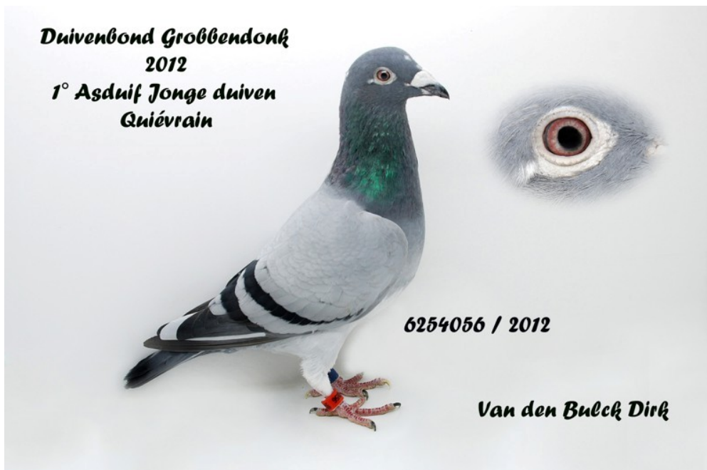
B-12-6254056 – 1 As gołąb młode Quiévrain w Duivenbond Grobbendonk w 2012!