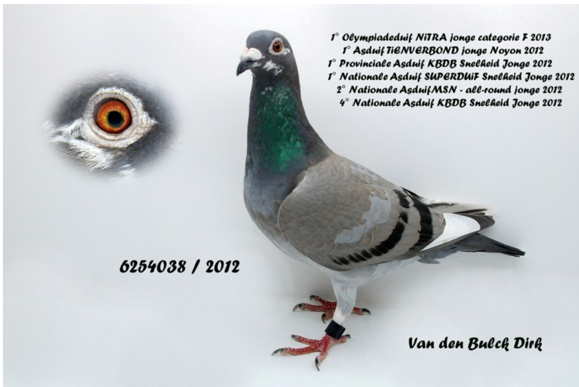
B-12-6254038; 1. olimpijski gołąb. Kat. F 2012, 1. w prowincji i 4. w kraju As-gołąb sprint młode 2012; 1. As-gołąb młode Noyon Duivenbond Grobbendonk w 2012!